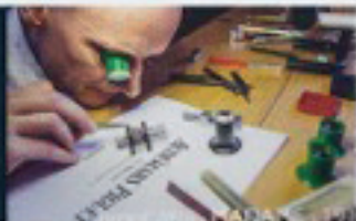
Ein Blick hinter die Kulissen bei Audemars Piguet